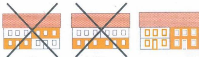
Schéma de principe des ravalements de façade :

L'attribution des subventions est soumise au respect des recommandations architecturales émises par l'autorité administrative et figurant dans la déclaration préalable.